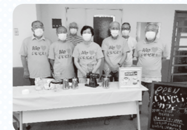
いいじいカフェの皆さん

私たちは、自我を出すとうまくいかないと思っています。ボランティアをやっているのではなく、自分の楽しみとしてやっている。もっと、気楽に、自分も楽しめる、来る人も楽しむ場づくりをしたい。メンバーは男性ばかりだが、男の職場って感じではない。来られるのは大半が女性。男性にもっと来てほしいと思います。自分が楽しむことが主です。この活動以外にも活動を広げていて、自分の活動範囲が広がった。カフェ以外にも、釣り等の仲間ができた。いいきっかけをもらったと思っています。