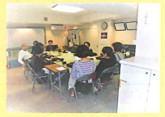
・リベラの皆さん