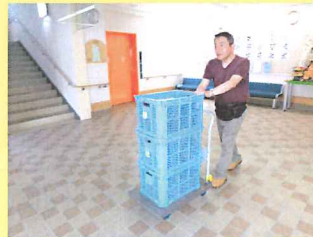
・ボランティアさんの 配食スタート