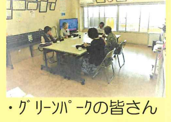
・グリーンパークの皆さん

☆幸ヶ丘自治会：毎回 17 名程の利用者で5名のボランティア。食後は時々歌を歌っています。