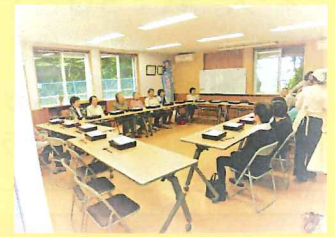
・幸ヶ丘の皆さん