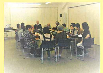
・ブロードの皆さん