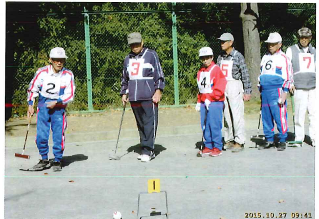
関係者の皆さんや又特に審判員の方々、本当にありがとうございました。お蔭さまで無事終了いたしました。

参加者の最高齢99歳(第3みのり会)の方が仲間と一緒に元気にプレーされていました。目標にしたいものです。