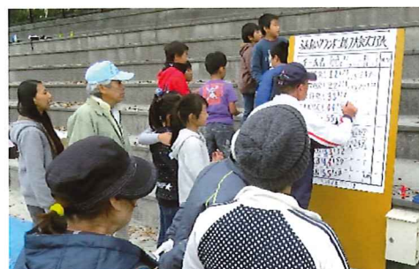
何位になったかな? スコア表が気になります

子どもたちと一つの目標に向かい和気藹々の中、無事に終了いたしました。大会にご協力くださった皆様、本当にありがとうございました。