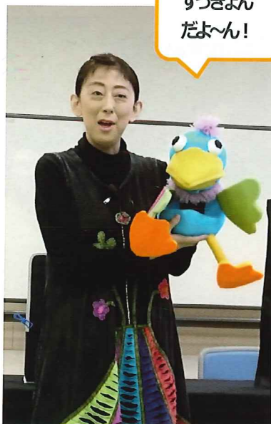
ずっきょんだよ〜ん!