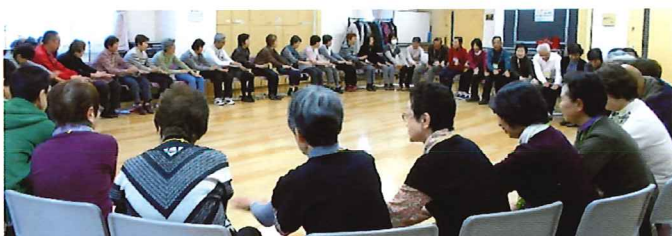
50人が大きな1つの輪になって