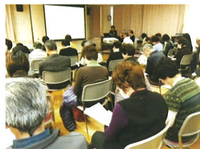
あなたのお付き合いの流儀は? アンケートに書き込む参加の皆さん

参加者に向けて「あなたのお付き合いの流儀は？」というアンケートが行われ、その結果を元に、ご近所がおせっかいになること、困った時は思い切って「助けて!」と言おう、とのお話を伺うことができました。