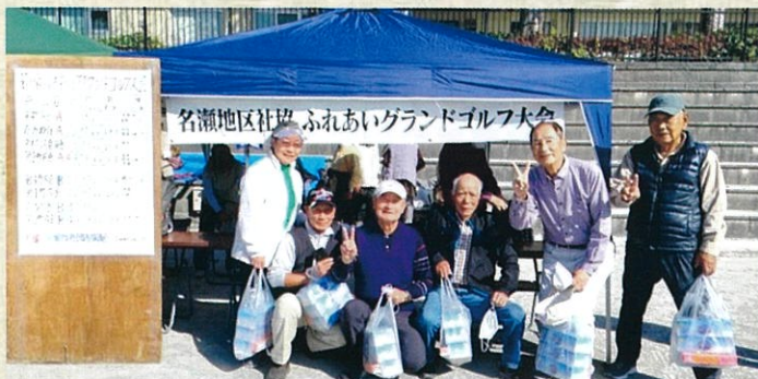
優勝チームの第二町内会(A)の皆さん

11月12日(土)、小春日和の中、名瀬地区社会福祉協議会主催の「ふれあいグラウンドゴルフ大会」が3年ぶりに名瀬中学校グラウンドにて開催されました。 コロナ禍の中の為、今回は高齢者(65歳以上)のみの参加になりました。