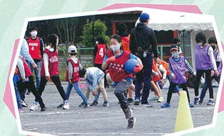
メディシンボール:小学生の部

開催中は雨に降られることもなく、またけがをした人もなく、楽しく健民祭を満喫することができました。来年もまた、元気よく健民祭に集い、おおいに楽しみましょう。