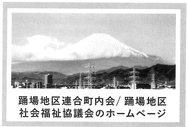
踊場地区連合町内会 / 踊場地区社会福祉協議会のホームページ

作成に当たっては、福田戸塚富士見丘ハイツ自治会会長を代表として自治会町内会および社会福祉協議会より数名の検討会メンバーが選出され意見交換を行いました。