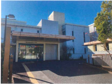
舞岡柏尾地域ケアプラザ