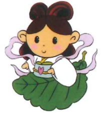
舞岡柏尾地域ケアプラザ マスコットキャラクター 【まいちゃん】

介護保険等のご相談、趣味のサークル活動やボランティア活動の場についてのご相談などをお受けする地域の身近な窓口です。どうぞお気軽に声をおかけください。