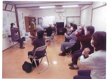
ふれあいサロン風景