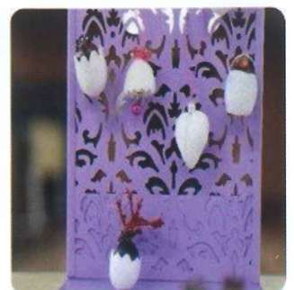
まゆで作った作品