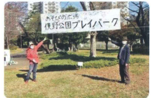
「俣野公園」プレイパーク