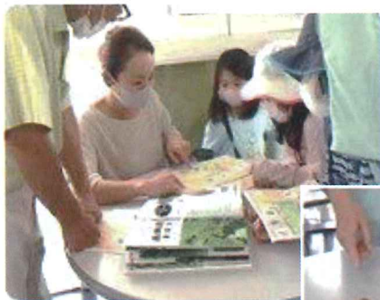
ドングリの勉強会