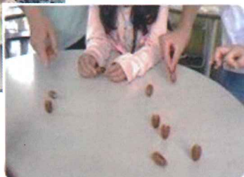
ドングリごまで遊んでいる