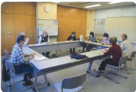
傾聴ボランティア“虹”