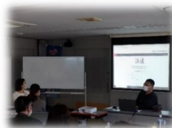
事業者連絡会における情報交換の様子