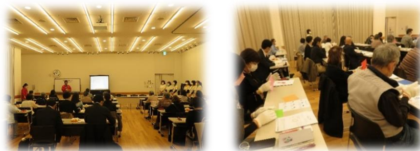
ガイドボランティア養成講座の様子

今年度も新型コロナウイルス感染症の影響を考慮せざる得ない状況でしたが、昨年実施ができなかった推進会議や事業者連絡会、ガイドボランティア養成講座を開催することができました。今後も感染症に考慮しながら、啓発活動等実施していきます。