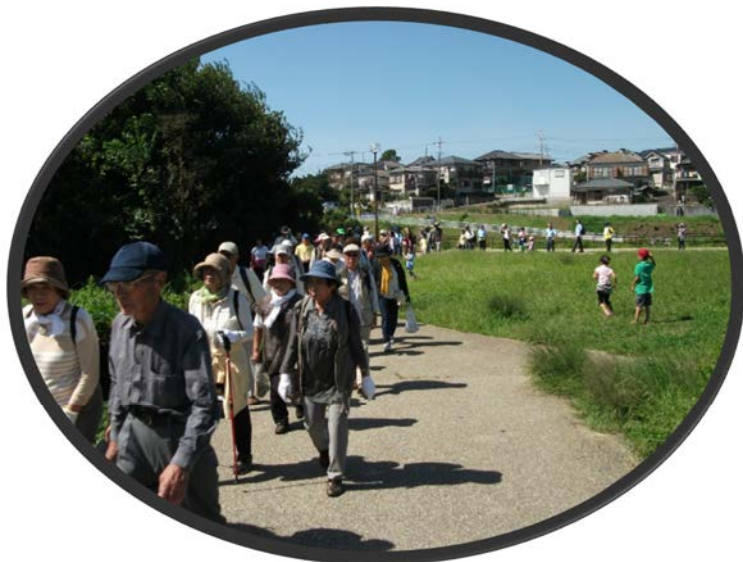
御所水公園の脇を通過中